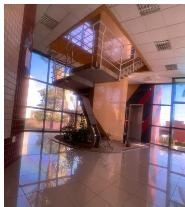
Imagem 08 - Fechamento de vidros nos acessos as escadarias