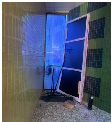
Imagem 07 - Local para alocação dos quadros de distribuição