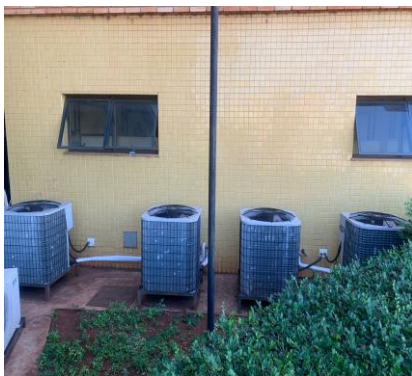
Imagem 09 - Ar Condicionados a serem desinstalados