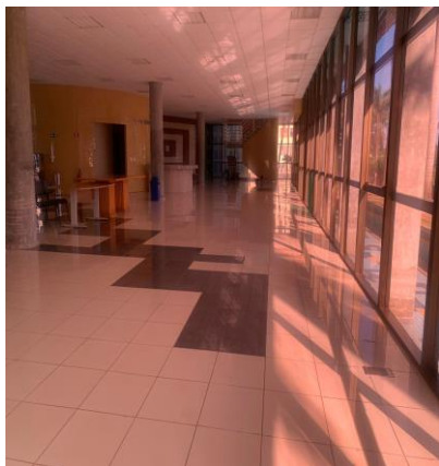
Imagem 05 - Local para alocação das evaporadoras