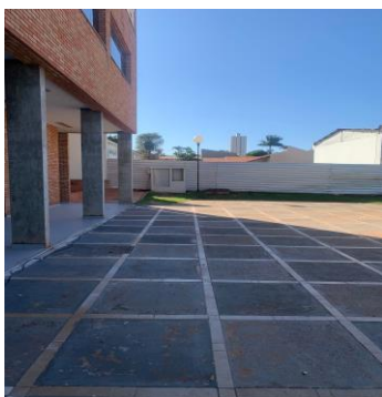
Imagem 03 - Localização do QGBT