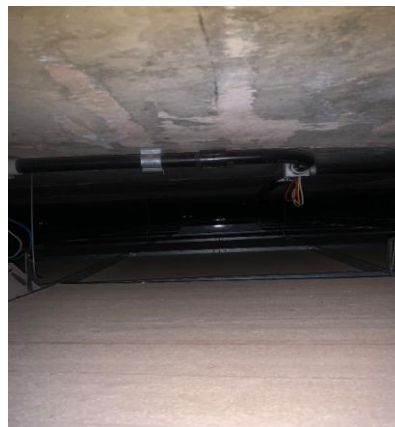
Imagem 06 - Entre forro