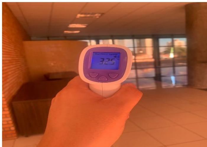
Imagem 02 - Temperatura ambiente registrada no saguão da sede do Crea-MS (32,5 °C)

2.3. É imprescindível a climatização deste local visando manter a qualidade do ar, pois além de atender às exigências legais, proporciona o bem-estar dos colaboradores que trabalham diariamente no edifício. Sabe-se que uma má climatização, seja pela qualidade do ar ou pela temperatura, pode causar problemas de saúde, visto imagem abaixo registrada no Estudo Técnico Preliminar.