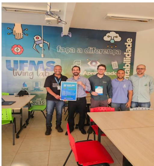
Foto 6: Reunião Preparatória em Chapadão do Sul/MS - Universidade Federal do Mato Grosso do Sul-UFMS