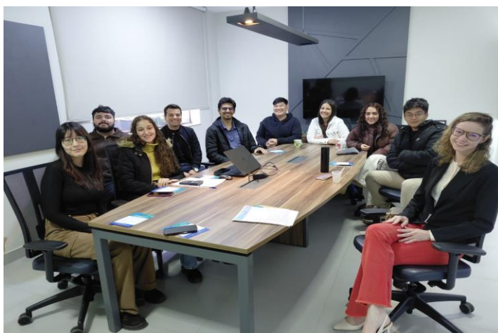
Foto 12: Reunião com os engenheiros locais na Corpore Incorporadora