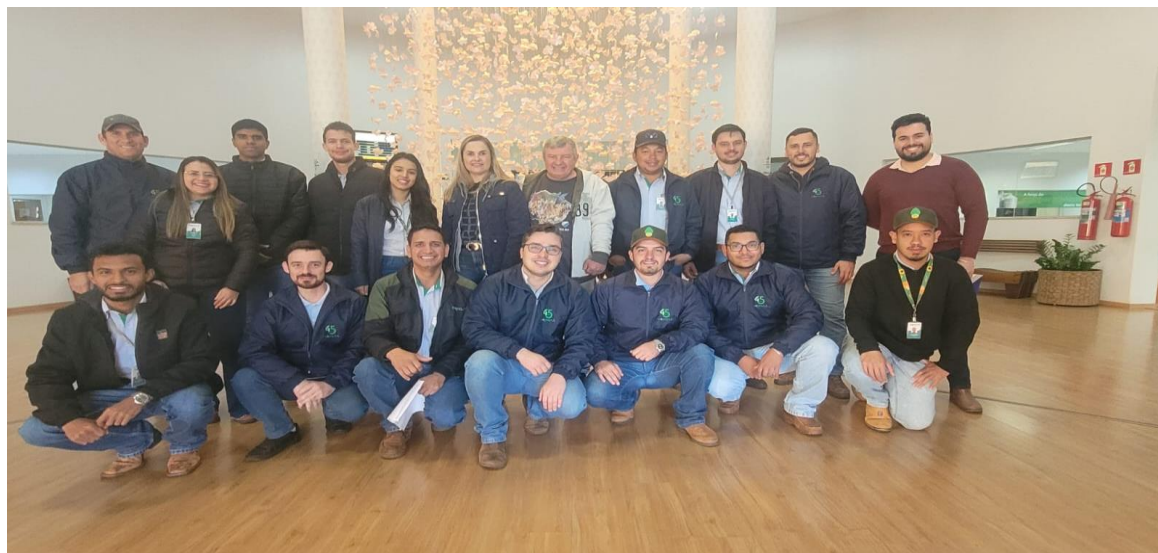
Foto 18: Visita à Cooperativa Agrícola Sul-mato-grossense - COPASUL