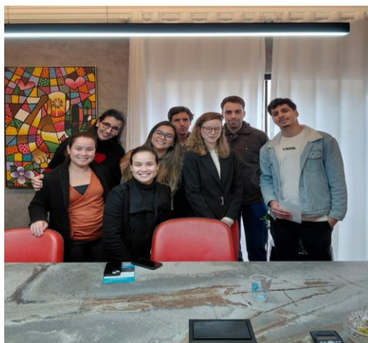
Foto 11: Visita à empresa Pettra Engenharia para convidá-los para o 3º Microrregional