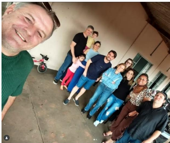
Foto 13: Reunião na Associação dos Engenheiros Agrônomos da Grande Dourados - AEAGRAN