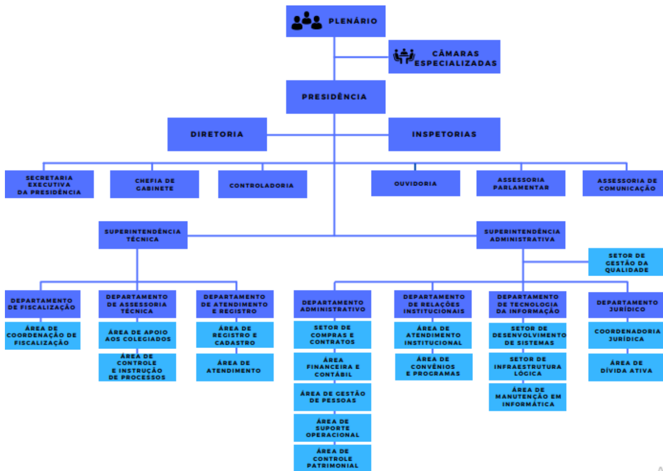
Figura 2. Organograma