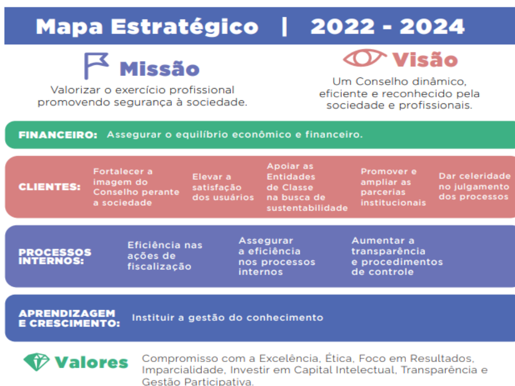
Figura 1. Mapa Estratégico

Instituído pela Resolução do Confea n. 263, de 20 de outubro de 1979, na forma estabelecida pelo Decreto Federal n. 23.569, de 11 de dezembro de 1933, o Crea-MS - Conselho Regional de Engenharia e Agronomia de Mato Grosso do Sul é entidade autárquica de fiscalização do exercício e das atividades profissionais dotada de personalidade jurídica de direito público, constituindo serviço público federal, vinculado ao Conselho Federal de Engenharia e Agronomia – Confea. A Lei 5.194/66 nos ampara no cumprimento do nosso papel institucional assim destacados no Planejamento Estratégico, que está desfasado, porém em fase de elaboração para atualização dos próximos anos.